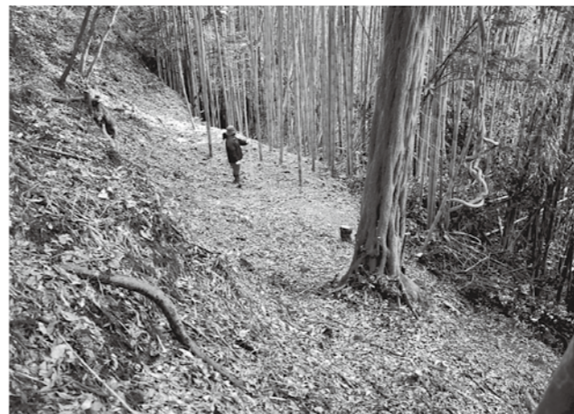
写真1 H-1通路からH-2を見る