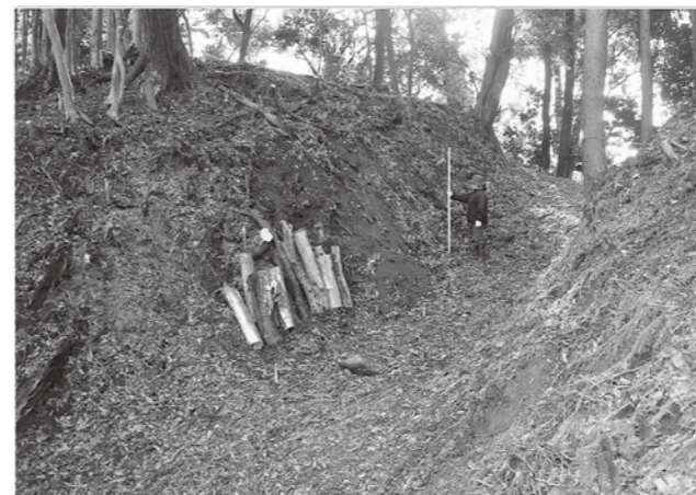
写真2 堀切5 (北西→南東)