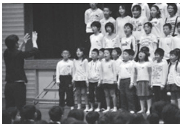
中央小児童による合唱