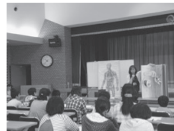
検査結果の説明に、皆さん熱心に耳を傾けていました

参加した児童と保護者からは、「痩せていると思っていたのに、中性脂肪が高いと思わなかった」、「マヨネーズやジュースにあんなにたくさんの油や糖分が入っているとは思わなかった」など、血液検査の結果をみて食生活の見直しや間食の取り方など、親子で見つめ直すことができていたようです。