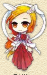
耳の神様「みゆちゃん」

こんにちは。今年度も広報を担当しますスリープです。よろしくお祈いします。 4月上旬に桜が満開でした。肥後民家村と歴史と文化のふれあい広場に取材に行きましたが、どちらも桜が満開でとてもきれいでした。 今年は、花見をする予定でしたが、雨のため中止に。来年こそは花見をしたいです。スリープは現在風邪気味です。皆さん、体調に気をつけて5月をお過ごしください。