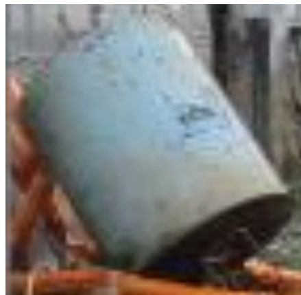
(写真左) 7月7日午前、冠水した重油タンク (右) 7月8日午後、水が引いた状況

記録的大雨がここ数年頻発しています。 今後も大雨が予想されますので、漏洩防止のためには事前の対策が重要です。