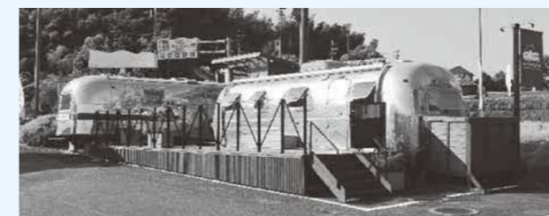
和水町移住定住支援センター

移住・定住者に向けたホームページを開設しました。実際に移住された人のインタビューや空き家バンク制度といった移住を検討している人向けの情報のほか、補助金の紹介や子育て支援策などを掲載しています。若者世帯や子どもの増加、地域活性化に向けて様々な情報を発信していきます。