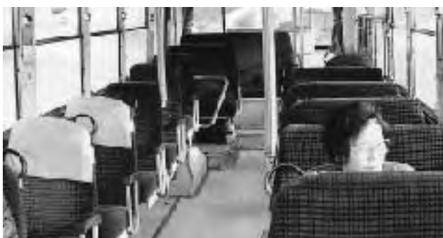
▲路線バスの車内は空席が目立ちます。