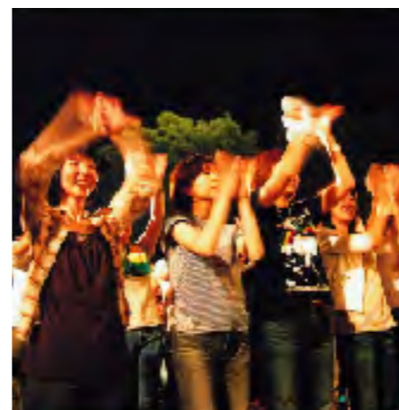
盛り上がりました 踊ったり歌ったり、お客さんもヒートアップ！笑顔いっぱいでした