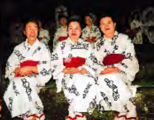
古墳踊りはいかがでした？ 婦人会のみなさんによる艶やかな古墳踊り。楽しんでいただけたでしょうか