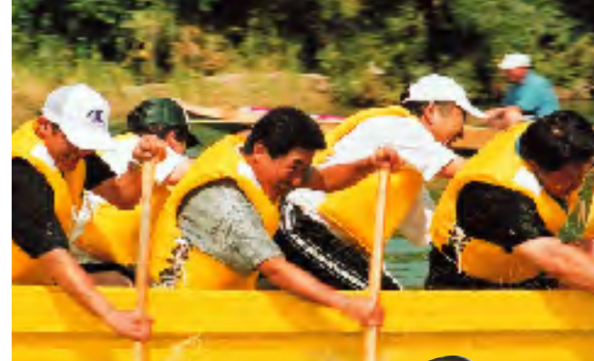
川舟ペーロン大会 力を合わせて、息を合わせてみんな真剣勝負！多くの人でにぎわいました