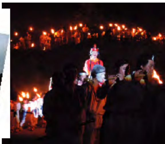
松明行列 古墳祭名物の松明行列。大人から子どもまで、800人の古代人が参加しました