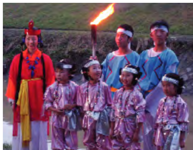
点火式 卑弥呼と子どもたちによる点火式は、みなさんを幻想的な世界へと導きました