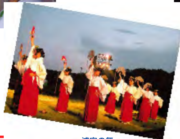
浦安の舞 中学3年生の巫女たちが見事な舞を披露しました