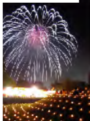
花火大会 ドーン！ドーン！3000発の花火が夜空で輝きました

合併して初めてとなる2006年の古墳祭。みなさんにとっては、どのような古墳祭になったでしょうか。今年の古墳祭も、2日間で行ったいろいろな催し物がありました。今日は、まちの話題をちよっと拡大して、夏の思い出、和町古墳祭をお届けしたいと思います。