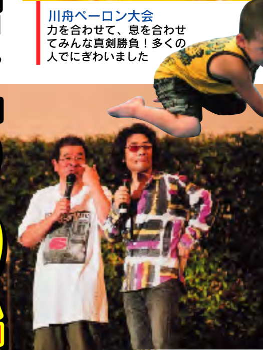
古墳祭ライブ 多くのお客さんが訪れ、ライブ会場は熱気に包まれました

合併して初めてとなる2006年の古墳祭。みなさんにとっては、どのような古墳祭になったでしょうか。今年の古墳祭も、2日間で行ったいろいろな催し物がありました。今日は、まちの話題をちよっと拡大して、夏の思い出、和町古墳祭をお届けしたいと思います。