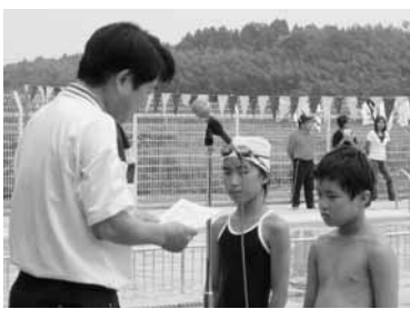
中村校長先生から表彰される様子