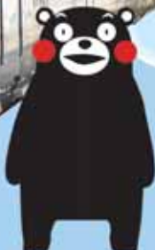
くまもとサプライズキャラクター「くまモン」