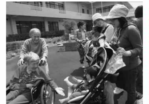
4月26日 「清風苑の中庭でお散歩」