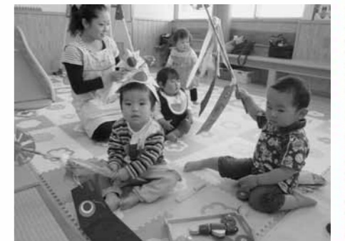
5月2日 「子どもの日のお祝い」