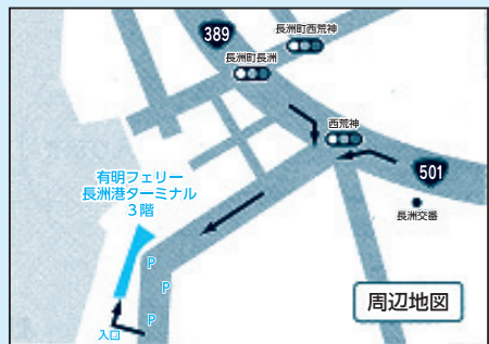
▲荒尾・玉名地域結婚サポートセンターの位置図

◎：荒尾・玉名地域結婚サポートセンター(玉名郡長洲町大字長洲2168番地25有明フェリー長洲港ターミナル3階) ☎0968-781-2543