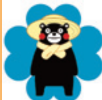
くまもとグリーン農業 応援宣言

これまでこの絆を大事にする とともに、さらに新しい絆を 広げていきたいものですね。 V605-1 職員