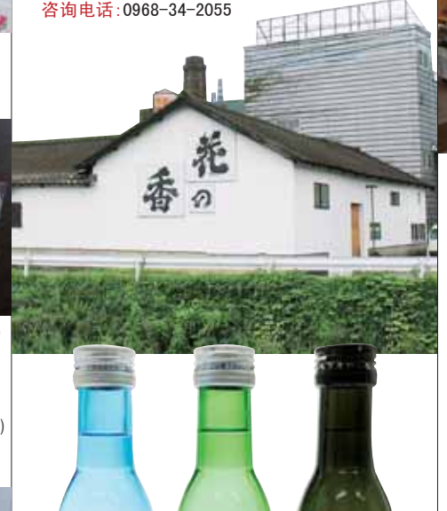
Sweet Potato Shochu "Yattsu no Kamisama" 이모소주 (여덟의 신) 芋头烧酒"八神"