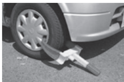
自動車の差押え(タイヤロック)