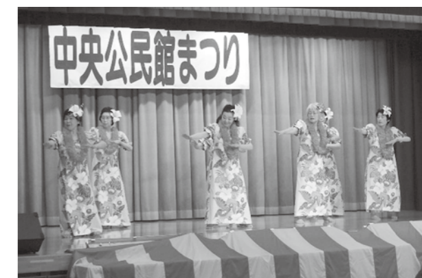
ステージ発表のようす