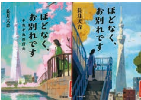
「ほどなくお別れです」 長月 天音 (小学館文庫)

気候変動や経済の不安、異国での争いごとにも無関係ではいられない状況に、私たちの気持ちは塞ぎがちになります。毎日の生活を少しでも明るく楽しんで送りたいものです。少し目先を変えて違った角度から物事をとらえるきっかけを与えてくれる本を、生活の一部に取り入れてみませんか？