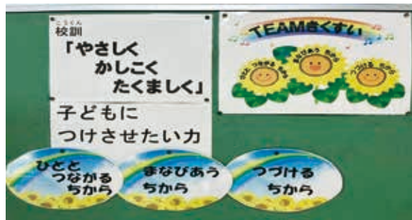
『みんなの笑顔のために』行動できる児童の育成

児童一人一人の笑顔が輝く1年になるよう全職員一丸となって頑張ります。ご理解、ご支援をよろしくお願いします。