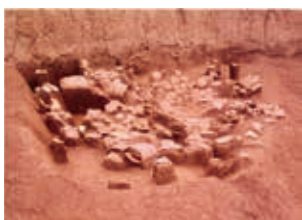
塚原遺跡 土器の出土状況

大原遺跡は、菊池川下流域右岸の有明海を望む標高15m程の台地上にあります。その周辺は弥生時代から古墳時代にかけての遺跡が特に集