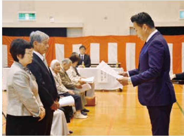
▲昨年度の表彰式の様子