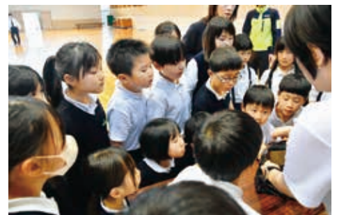
▲児童・生徒たちが防災を身近な問題として考える機会となりました

地震の発生を想定して、児童・生徒たちは、机の下で身を守る、避難するなどの行動を実際に行いました。また、地域防災啓発活動に取り組んでいる東京海上日動火災保険(株)熊本支店からのお話を聞き、地震や豪雨などの自然災害発生時に、どのような行動をとるべきか、日頃から備えておくべき防災グッズなどについて学びました。