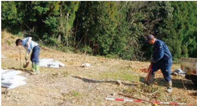
▲センダンを植樹している様子

熊本県では、成長が早く、家具材としても利用されている落葉広葉樹「センダン」の植栽を推進しています。今回、地権者の方の協力を得て、中和仁区にある果樹園の一部を伐採し、センダンを植えました。実証実験として、センダンの成長促進、また地域で発生する家畜由来の堆肥を有効に活用する循環型林業を実現するために、牛糞、豚糞、鶏糞の3種類の堆肥を使って成長比較を行っています。センダンの材は、福岡県大川市の家具メーカーからも注目されており、現在、スギの3倍ほどの価格で取引されています。ご興味のある方は玉名地域振興局林務課（☎0968・74・2138）までお問い合わせください。