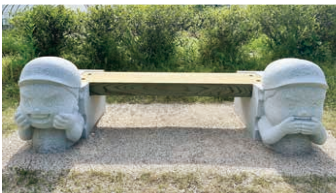
▲「なごみん」をかたどったベンチ