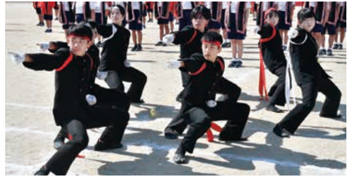
▲菊水中学校 応援団演舞

鯉のぼりリレーや、綱引き、長縄跳び、団対抗リレーなど、子どもたち1人1人が一生懸命で、輝く姿が見られました。