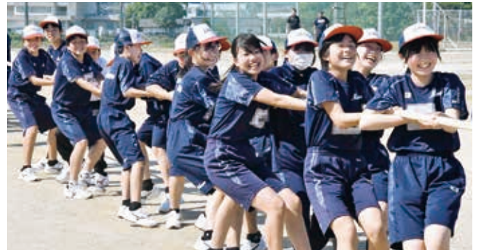
▲三加和中学校 綱引き