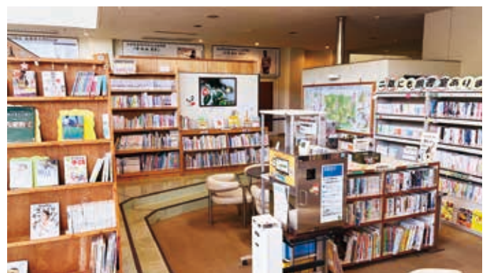
▲三加和公民館図書室の様子

いただいた寄付金は、利用者の皆さまの学びや読書活動の充実につながる図書の購入に活用させていただきます。誠にありがとうございました。