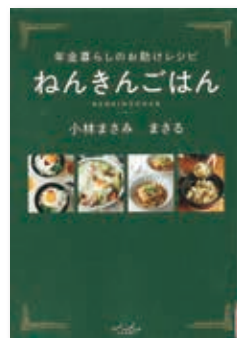
「ねんきんごはん」 小林まさみ まさる (内外出版社)

人気アイドルの出演で映画化され、話題になりました。映画をご覧になった方もいらっしゃると思います。映画を観た方も、見逃した方も、読んでみませんか？