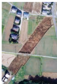
大原遺跡 遺構検出状況

山鹿市にある国指定史跡「方保田東原遺跡」は、史跡の一部が芝生公園として整備されています。また、国指定になっている出土品は、隣接する山鹿市出土文化財管理センターなどで見ることが出来ます。