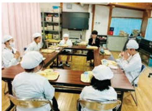
よりよい三加和小にするために

「子どもまんなか」の考えのもと、自分たちの学校をよりよくしようと、考え、話し合い、工夫しながら活動を進めています。あいさつ運動や集会活動では、「友達が大好き」「学校が大好き」と感じられる学校づくりを目標に、みんなで力を合わせる姿が見られます。互いの思いを大切にしながら関わり合う中で、思いやりの心や協力する力も育まれています。