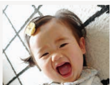
あこさん (1歳) あこちゃん1歳おめでとう♡ ねえねいにいと元気に育ってね!

8月生まれの6歳までのお子さまの写真を募集します。 ▼応募方法：7月3日(金)に、和水町公式LINEで配信される応募フォームからお申し込みください。