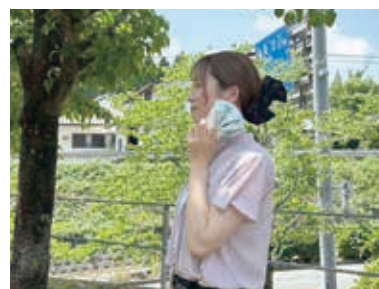
▲無理をせず、こまめに休憩をとる