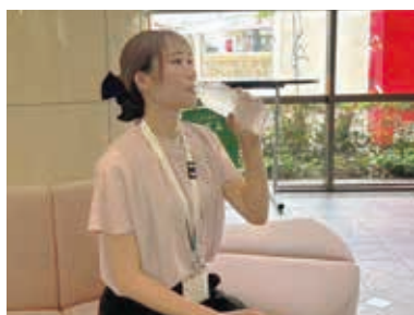
▲喉が渇く前に、こまめに水分をとる