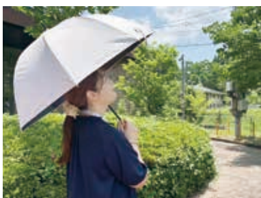
▲帽子や日傘で涼しく 日陰を選んで暑さを避ける