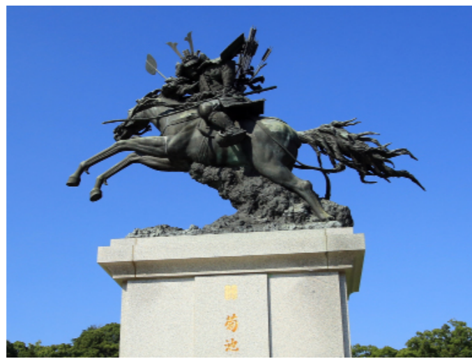
九州を平定した菊池武光公騎馬像（菊池市）