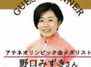
アテネオリンピック金メダリスト